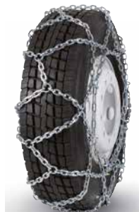
pewag austro super reinforced