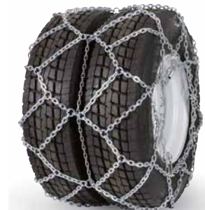
pewag austro super twin