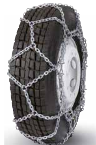
pewag austro super