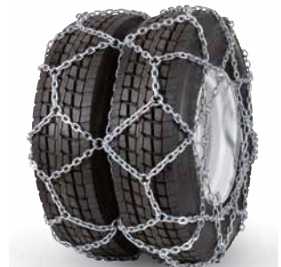
pewag austro super reinforced twin